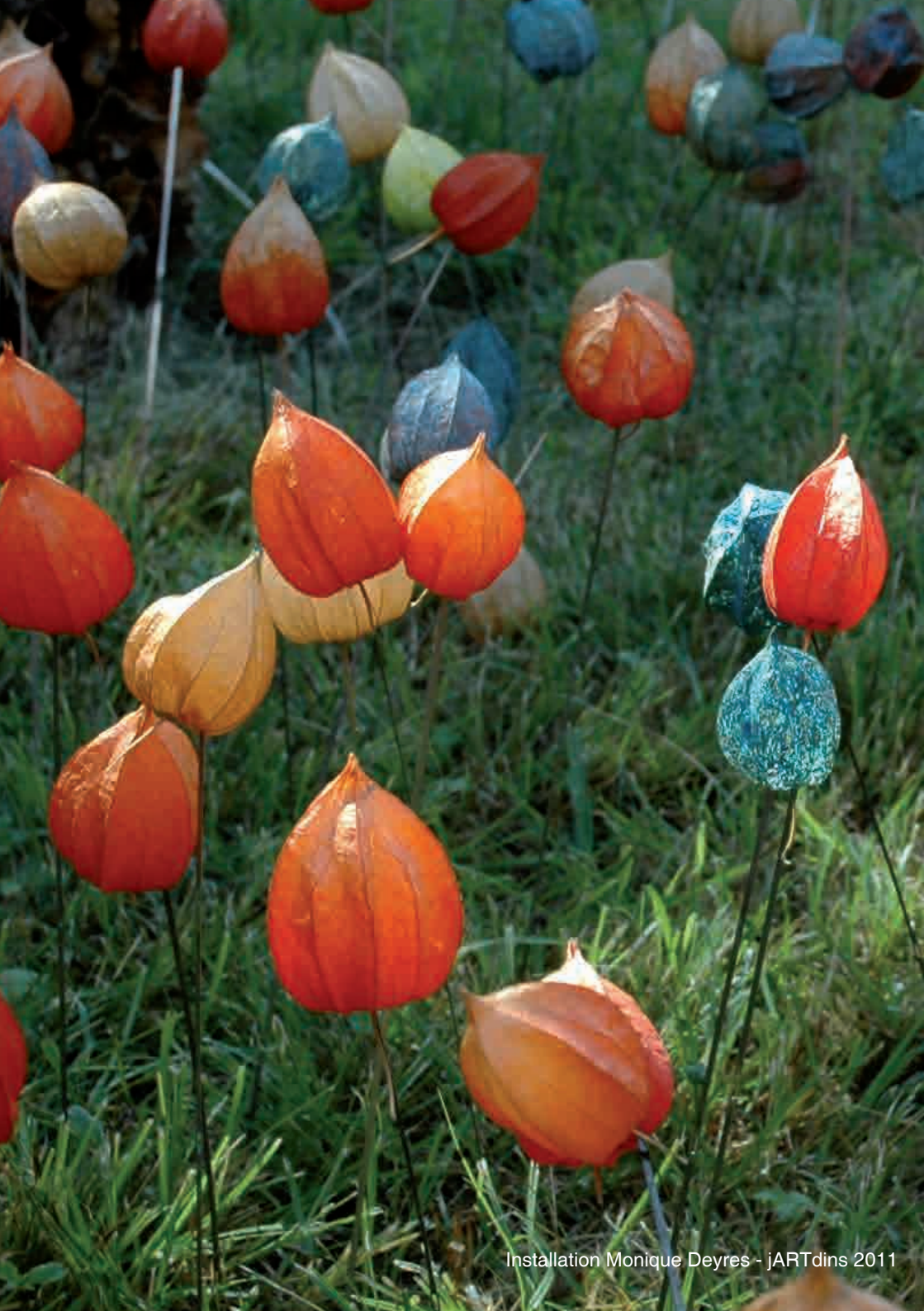
Installation Monique Deyres - jARTdins 2011