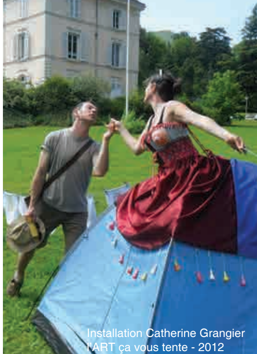
Installation Catherine Grangier l'ART ça vous tente - 2012